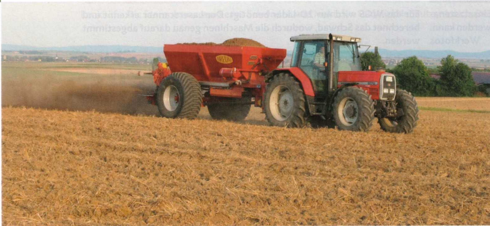
Kalk wird als Dünger für den Boden ausgebracht.

Mit der Verschärfung von Gesetzen und Auflagen auch im Bereich Düngung wird immer häufiger über die Bodenfruchtbarkeit gesprochen. Im Diskussionspapier der Bundesregierung »Ackerbaustrategie 2035« steht der Humusaufbau im Schwerpunkt zur Förderung der Bodenfruchtbarkeit. Doch damit allein ist es nicht getan. Welche Faktoren und Maßnahmen die Bodenfruchtbarkeit noch beeinflussen, soll der folgende Artikel aufzeigen.